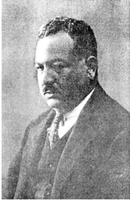
صورة المؤلف محمد لطفي جمعة.